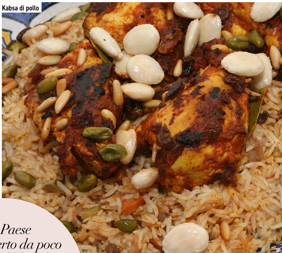
Kabsa di pollo

“Un Paese che ha aperto da poco al turismo e al liberalismo europeo, eppure la sua capitale, sull’Altopiano del Najd, è già tra le più avanzate del Middle East”